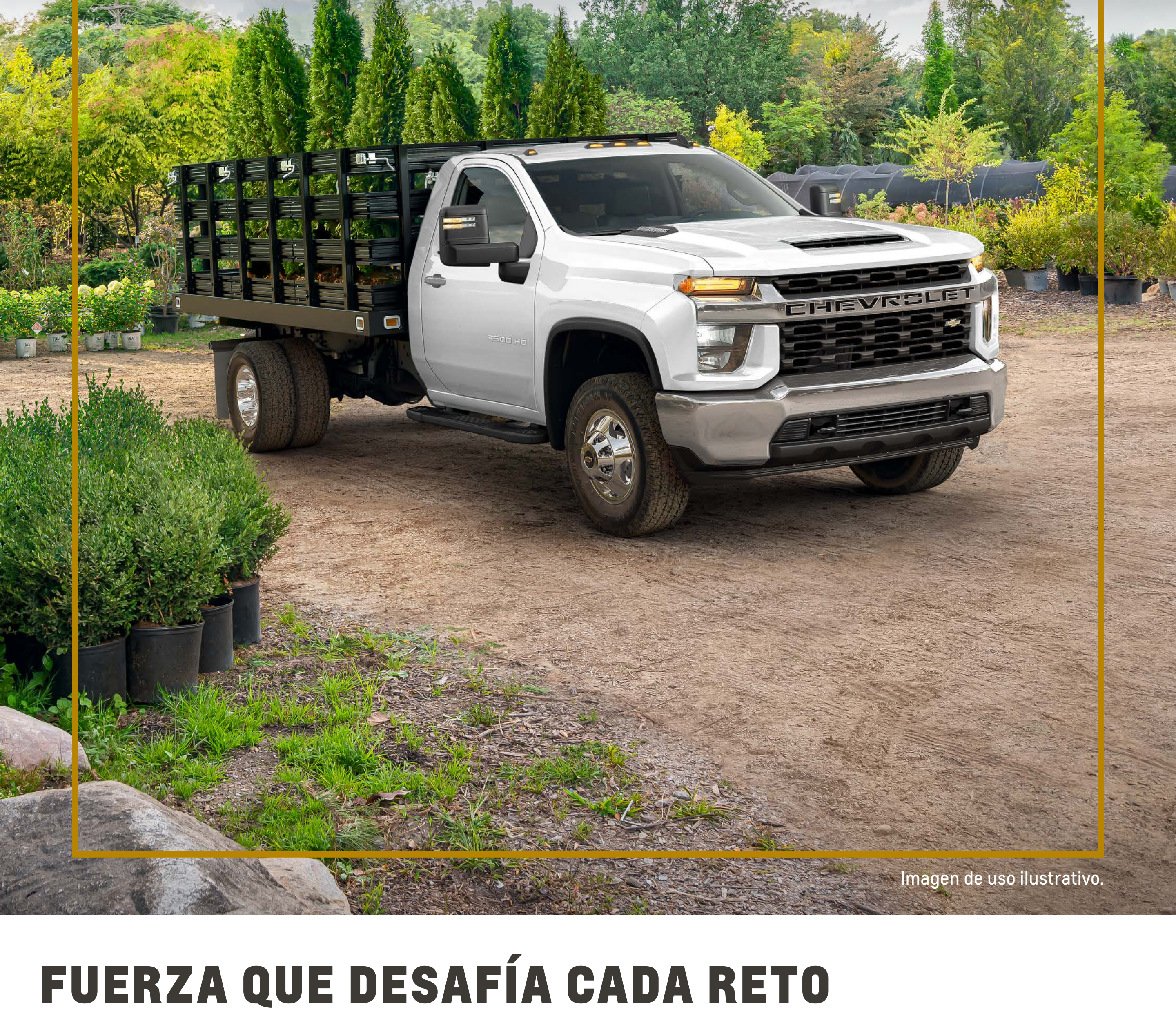
Imagen de uso ilustrativo.

INTIMIDANTE CAPACIDAD CON GRANDES DIMENSIONES.